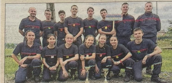
Les JSP de la caserne Rochat ont terminé 1 ers lors des journées de concours à Aubenas

Samedi dernier 3 juin, s'est déroulé à Aubenas, le rassemblement technique régional de jeunes sapeurs-pompiers regroupant un challenge sportif et un concours de manœuvre. 18 équipes de jeunes sapeurs-pompiers (JSP) de la région Auvergne Rhône-Alpes (AuRA), ont participé à ce rassemblement.