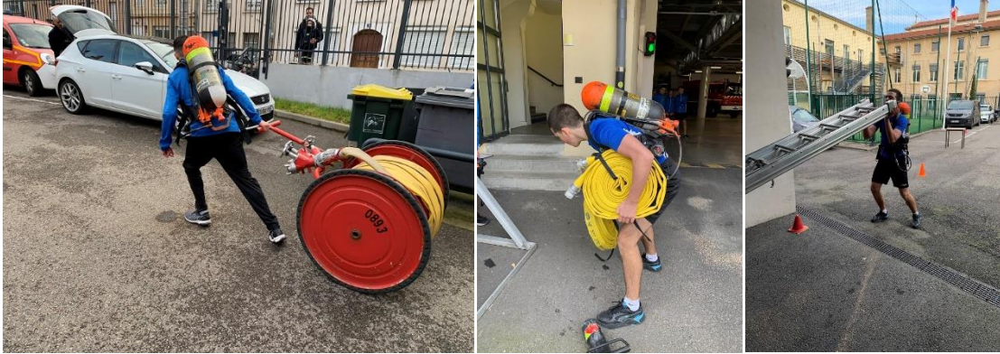
Puis cours sur les sauvetages de sauveteur pour les JSP 3-4

25 février : Parcours Adapté à l'Opérationnel pour l'aptitude sportive d'un équipier Incendie. Les JSP 3 ème et 4 ème année doivent le réaliser en moins de 5 min